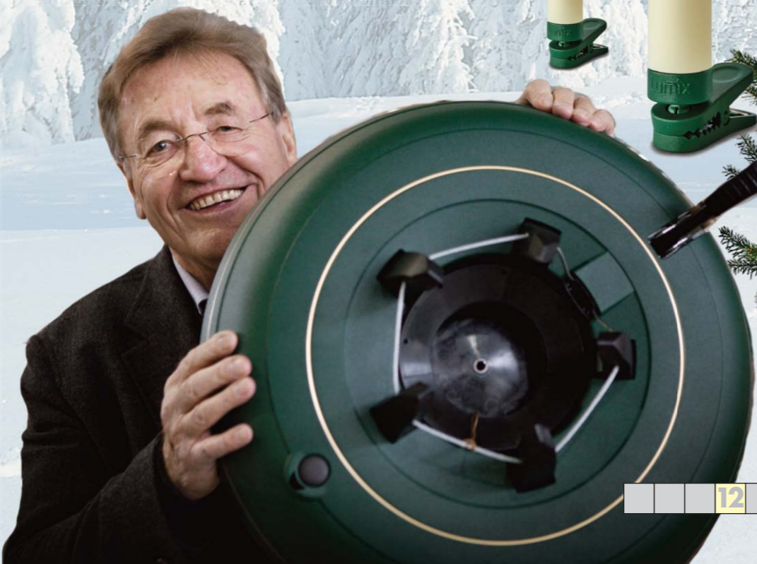
Wie steht der Baum in Sekundenschnelle?

den Christbaumständer aus recyceltem Kunststoff. Auch Vater und Sohn freuen sich über die Erfindung, denn nun haben sie schnell den Baum gerade aufgestellt und können ihn mit Christbaumschmuck behängen.